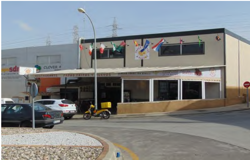
Foto 1. Vista de la estructura objeto del expediente

- Estructura metálica y techado con placa tipo sándwich con una superficie de 73'50 m 2 .