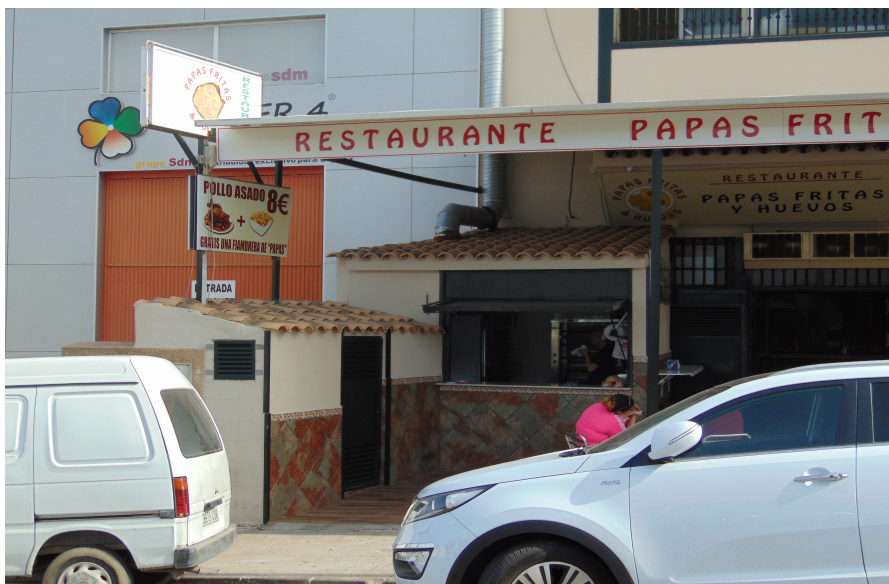
Foto 2. Vista del asador y almacén objeto del expediente

2º.- Consultados los datos al respecto no consta licencia municipal para realizar la estructura descrita.