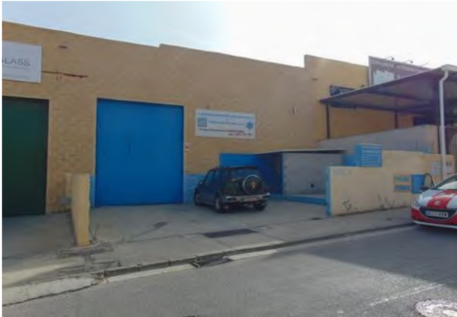
Foto 1. Vista del almacén objeto del expediente