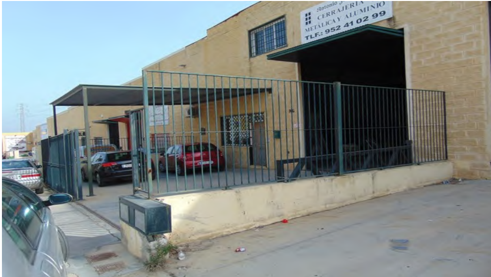
Foto 1. Vista de la estructura objeto del expediente

2º.- Consultados los datos al respecto no consta licencia municipal para realizar la estructura descrita.