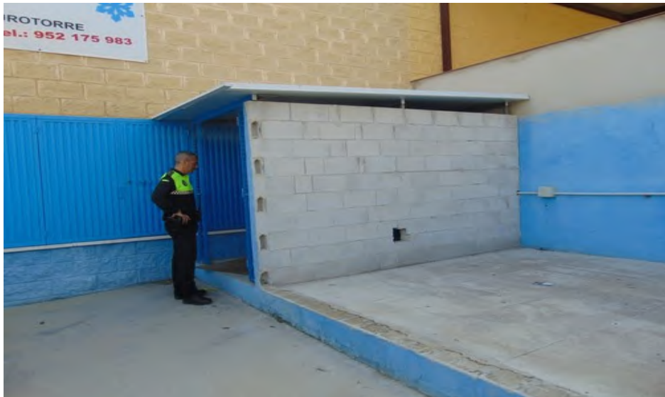
Foto 2. Vista del almacén objeto del expediente

2º.- Consultados los datos al respecto no consta licencia municipal para realizar la estructura descrita.