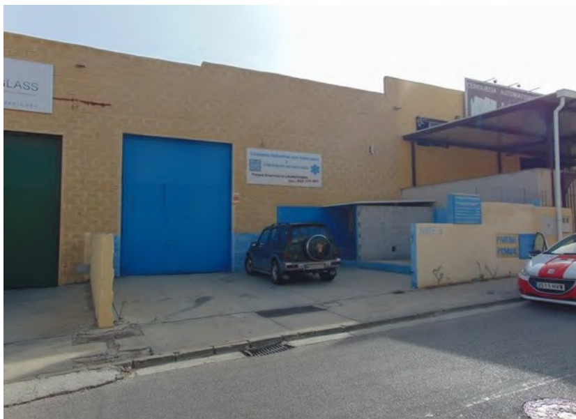
Foto 1. Vista del almacén objeto del expediente

Es de planta rectangular con unas medidas de 1'71 mts. x 3'50 mts. (5'98 m 2 ) y una altura de 2'60 mts.