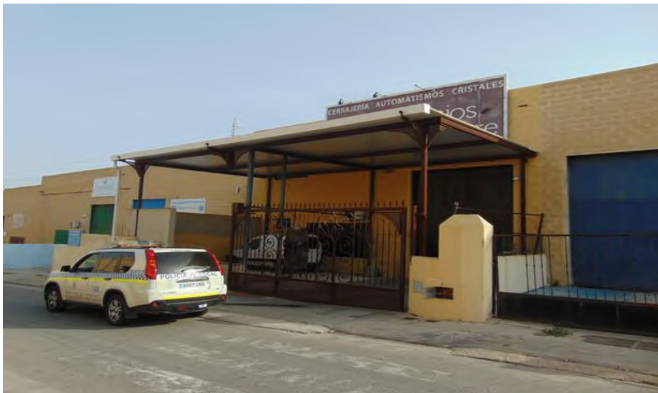
Foto 1. Vista de la estructura objeto del expediente

Las obras consisten en una estructura metálica y techado con placa sándwich con unas medidas de 7'00 mts. x 12'00 mts. (84'00 m²).