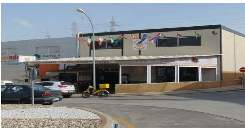
Foto 1. Vista de la estructura objeto del expediente