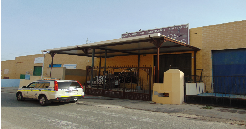
Foto 1. Vista de la estructura objeto del expediente

2º.- Consultados los datos al respecto no consta licencia municipal para realizar la estructura descrita.