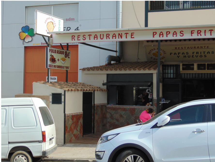
Foto 2. Vista del asador y almacén objeto del expediente

2º.- Consultados los datos al respecto no consta licencia municipal para realizar la estructura descrita.