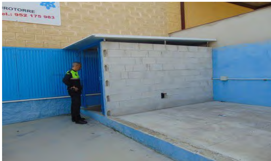
Foto 2. Vista del almacén objeto del expediente