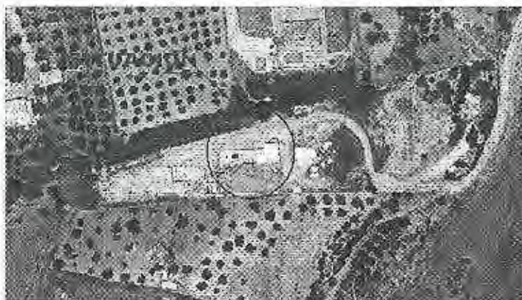
Fotografía aérea de la construcción denunciada de fecha julio de 2011

PLAZA DE LA JUVENTUD, SIN C.P. 29130 TELF. 952 41 71 50 FAX 95 241 33 38