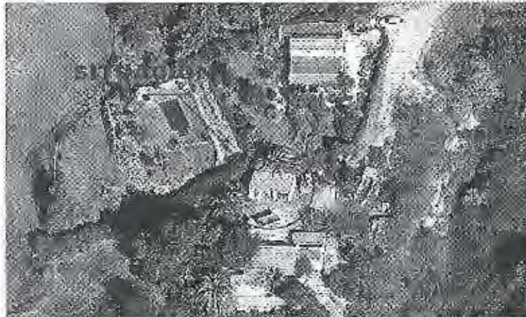
VISTA AÉREA DE LA PARCELA OBTENIDA DEL PROGRAMA GOOLZOOM

3º/ Las obras se encuentran en ejecución (80%).