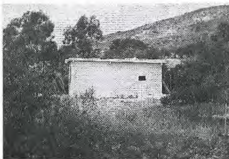
FOTO 2 (fecha 10/12/2015). Vista de la vivienda (edificación reformada y ampliada).