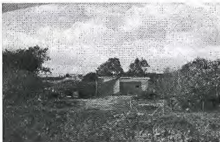
FOTO 1 (fecha 10/12/2015). Vista de la vivienda (edificación reformada y ampliada).

07/07/2016 y una fotografía aérea obtenida del GOOL-ZOOM donde se observa la edificación objeto del expediente antes de ser reformada y ampliada.