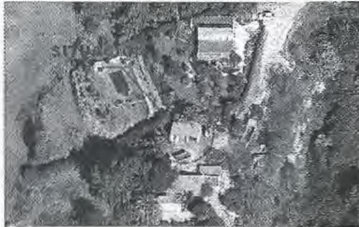
VISTA AÉREA DE LA PARCELA OBTENIDA DEL PROGRAMA GOOLZOOM

3º Las obras se encuentran en ejecución (80%).