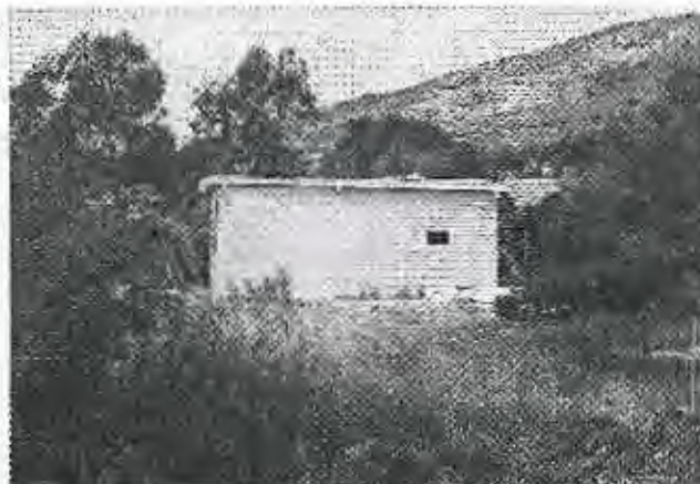
FOTO 2 (fecha 10/12/2015). Vista de la vivienda (edificación reformada y ampliada).