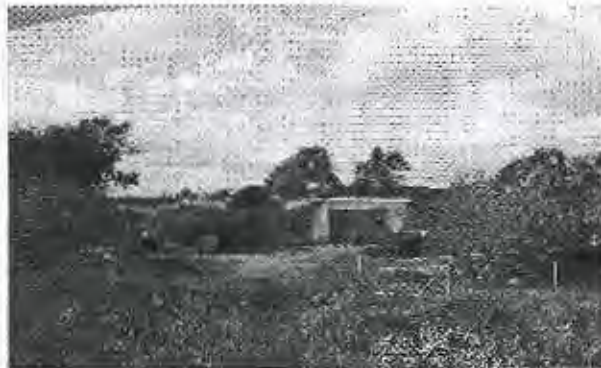
FOTO 1 (fecha 10/12/2015). Vista de la vivienda (edificación reformada y ampliada).

Para un mejor entendimiento de lo anteriormente descrito, se expone a continuación fotografías realizadas durante la visita de inspección referida de fecha 10/12/2015, así como una posterior visita de inspección de fecha 07/07/2016 y una fotografía aérea obtenida del GOOL-ZOOM donde se observa la edificación objeto del expediente antes de ser reformada y ampliada.