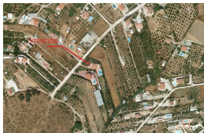
Fotografía aérea de la parcela donde se observan las edificaciones de fecha Julio de 2005

Por parte del técnico firmante se ha comprobado que efectivamente la vivienda objeto del expediente aparece en la fotografía aérea que obra en el departamento de urbanismo de fecha julio de 2005, por la que la antigüedad de las edificaciones es de al menos JULIO DE 2005.