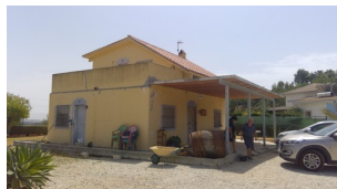
Fotografías de la vivienda realizadas durante la visita de inspección de fecha 20/07/2018

1º.- Que previo a la emisión de este informe, por parte del técnico firmante se ha realizado visita de inspección para comprobar “in situ” las características de la edificación descrita (VIVIENDA UNIFAMILIAR AISLADA) objeto de este certificado.