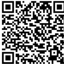
Código QR para validación en sede

Regulación CSV: Decreto 3628/2017 de 20-12-2017