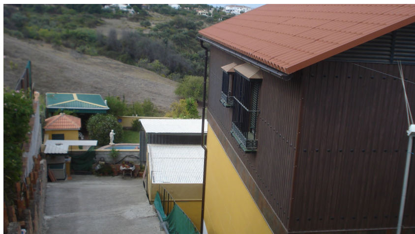
Foto 2. Vista donde se observa el desnivel de la parcela con la planta semienterrada