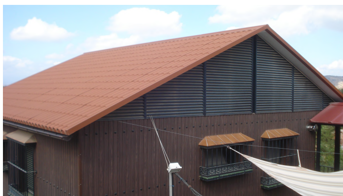
Foto 1. Vista exterior de la vivienda

Se exponen a continuación fotografías realizadas durante la visita de inspección realizada el 15/10/2015 por el inspector urbanístico del Departamento, para un mejor conocimiento de lo anteriormente descrito.