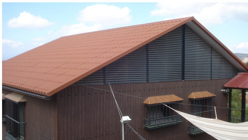
Foto 1. Vista exterior de la vivienda

Se exponen a continuación fotografías realizadas durante la visita de inspección realizada el 15/10/2015 por el inspector urbanístico del Departamento, para un mejor conocimiento de lo anteriormente descrito.