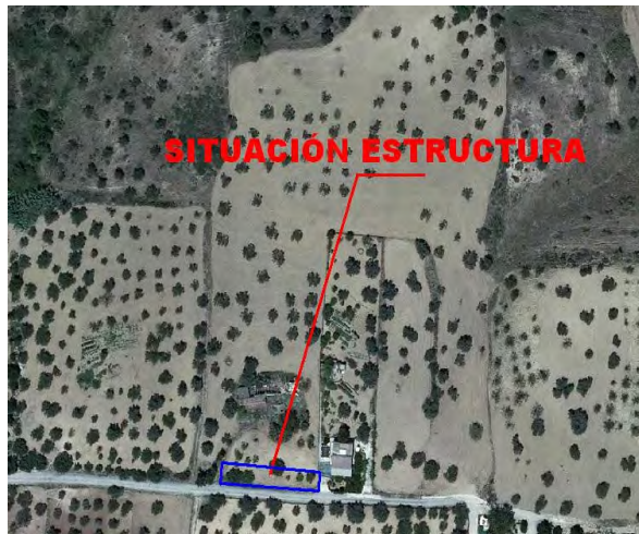
Situación en fotografía aérea de fecha julio de 2011

PLAZA DE LA JUVENTUD, S/N C.P. 29130 TELF. 952 41 71 50 FAX 95 241 33 36