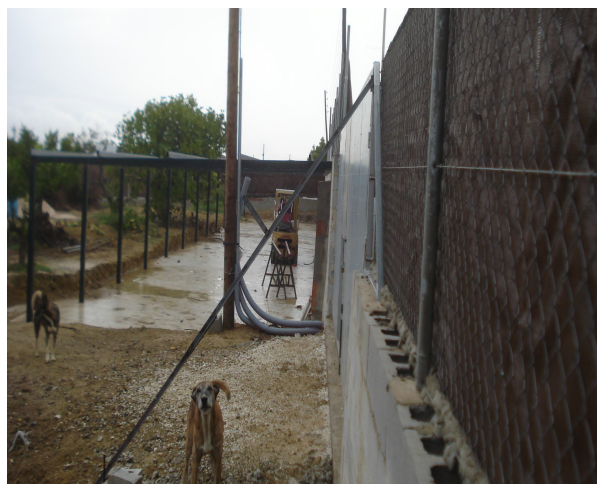
Fotografía de la construcción denunciada de realizada durante la inspección de fecha 19/10/2015

3º Las obras se encuentran en ejecución (aproximadamente el 20%).