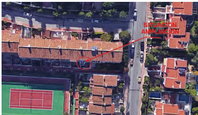
Situación de la edificación objeto de la denuncia

2º.- Que las obras denunciadas se han realizado sin la preceptiva licencia municipal