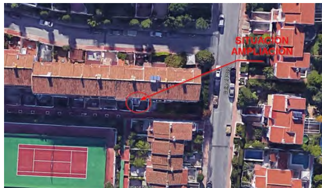
Situación de la edificación objeto de la denuncia