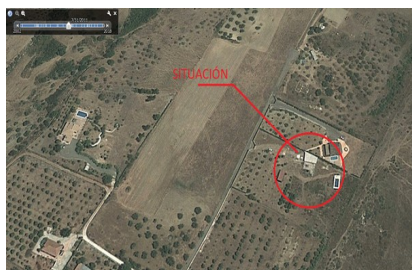
Fotografía aérea de la parcela donde se observan las edificaciones de fecha Julio de 2011

Por parte del técnico firmante se ha comprobado que efectivamente la vivienda objeto del expediente aparece en la fotografía aérea obtenida del programa Google-earth de fecha julio de 2011, por la que la antigüedad de las edificaciones es de al menos JULIO DE 2011.