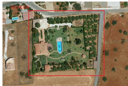
Fotografía aérea de la parcela donde se observan las edificaciones de fecha julio de 2005

Por parte del técnico firmante se ha comprobado que efectivamente las edificaciones objeto del expediente (vivienda unifamiliar aislada y construcciones anexas) aparecen en la fotografía aérea que de fecha JULIO 2005, por la que la antigüedad de la vivienda es de al menos JULIO DE 2005.