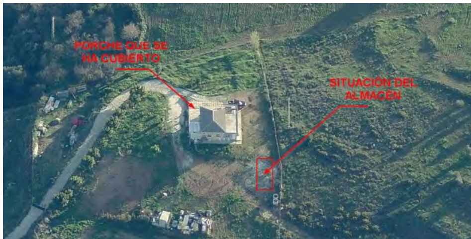
Estado de la parcela previo a la construcción de las obras objeto del expediente obtenidas del programa GOOLZOOM