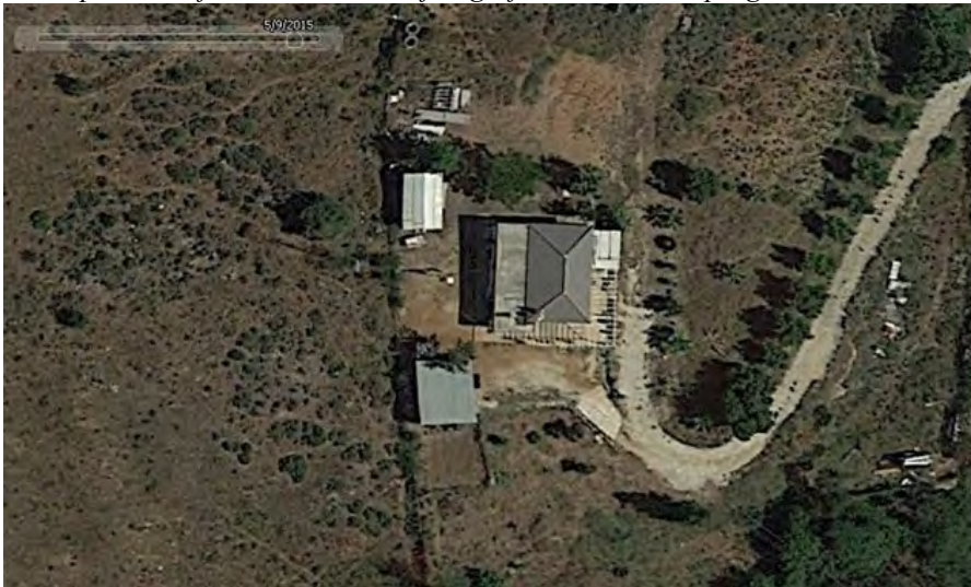
Estado de la parcela a fecha 09/05/2015.