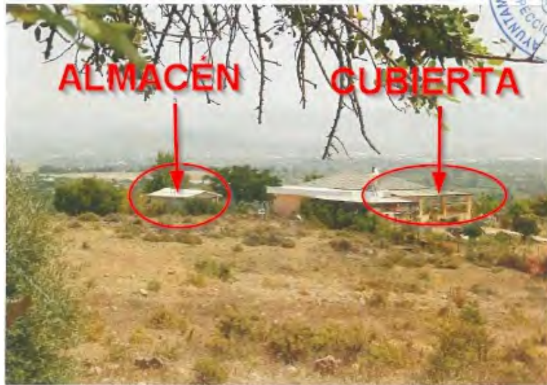
Fotografías realizadas durante la visita de inspección referida de fecha 05/08/2016, situando las edificaciones objeto del expediente (almacén y cubierta de porche)

EDIFICIO PUNTO INDUSTRIAL C.P. 29130 TELF. 952 41 71 50 FAX 95 241 33 36