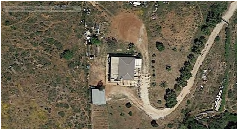
Estado de la parcela a fecha 24/04/2012.

EDIFICIO PUNTO INDUSTRIAL C.P. 29130 TELF. 952 41 71 50 FAX 95 241 33 36