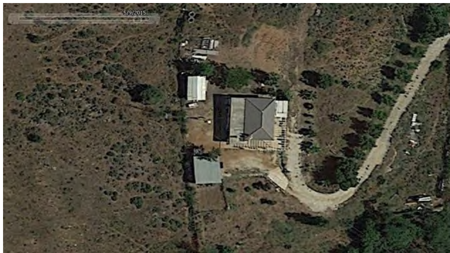
Estado de la parcela a fecha 09/05/2015.