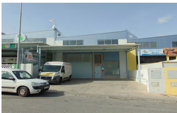
Foto 1. Vista de la estructura objeto del expediente

Las obras consisten en una estructura metálica y techado con placa sándwich con unas medidas de 5'60 mts. x 10'00 mts. (56'00 m²).