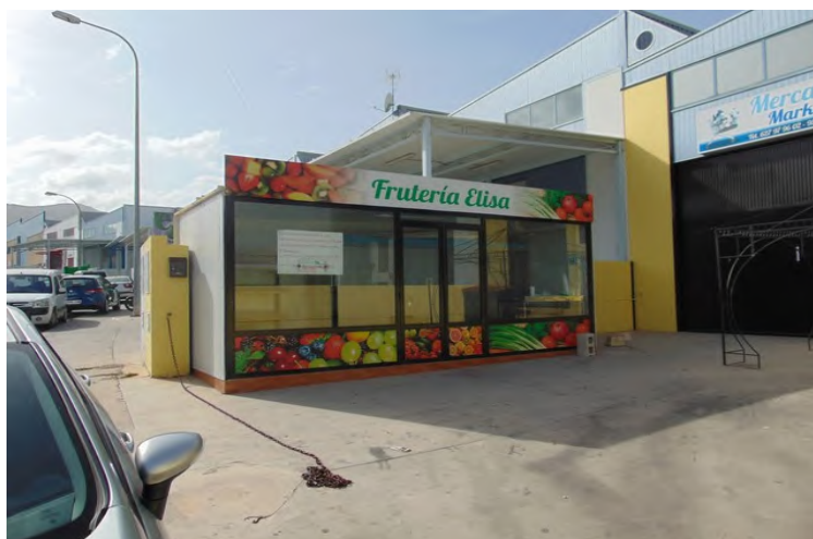
Foto 1. Vista de caseta objeto del expediente

Las obras denunciadas consisten en colocar una caseta prefabricada con una superficie de 10'00 m 2 (5'00 m x 2'00 m).