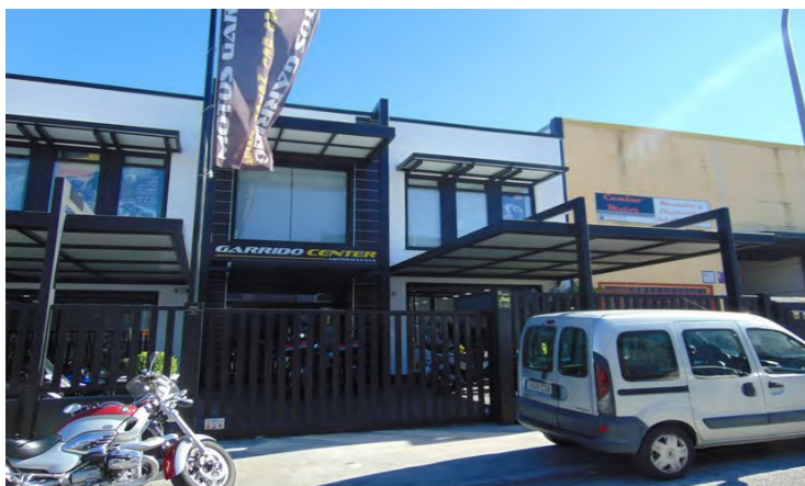
Foto 1. Vista de las dos marquesinas objeto del expediente

- Dos marquesinas metálicas techadas con una superficie cada una de ellas de 30'55 m 2 (4'70 m x 6'50 m) realizadas en la zona de entrada de la parcela anexas al lindero público, es decir una superficie total 61'10 m 2 .