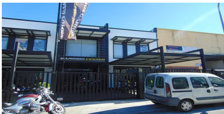
Foto 1. Vista de las dos marquesinas objeto del expediente

- Dos marquesinas metálicas techadas con una superficie cada una de ellas de 30'55 m 2 (4'70 m x 6'50 m) realizadas en la zona de entrada de la parcela anexas al lindero público, es decir una superficie total 61'10 m 2 .