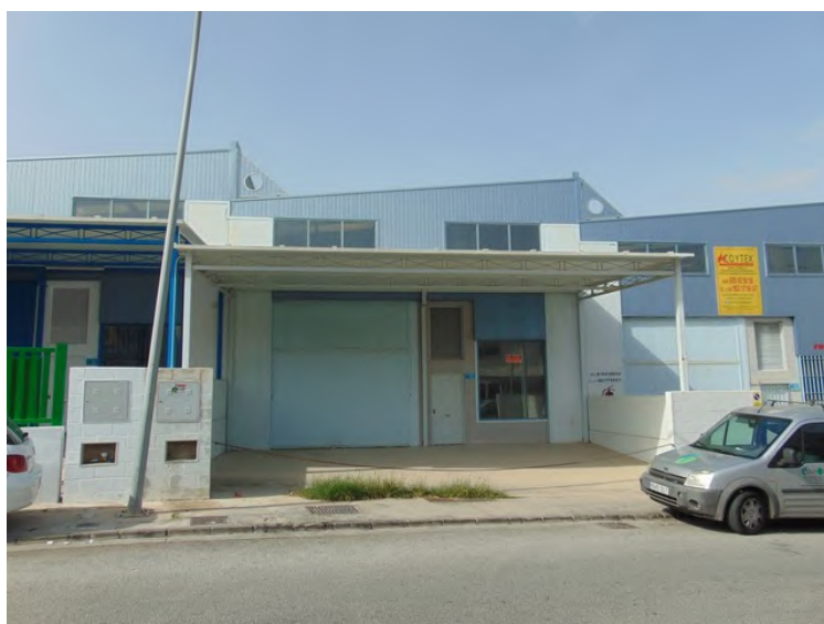
Foto 1. Vista de la estructura objeto del expediente

Las obras consisten en una estructura metálica y techado con placa sándwich con unas medidas de 5'60 mts. x 10'00 mts. (56'00 m²).