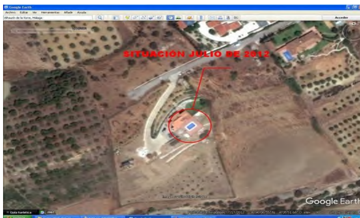
Fotografía aérea de la parcela 07/2012