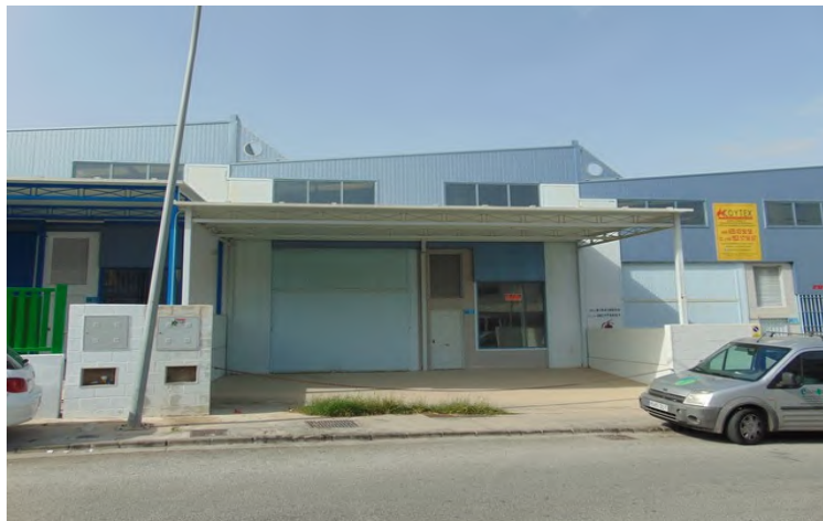
Foto 1. Vista de la estructura objeto del expediente

Las obras consisten en una estructura metálica y techado con placa sándwich con unas medidas de 5'60 mts. x 10'00 mts. (56'00 m²).