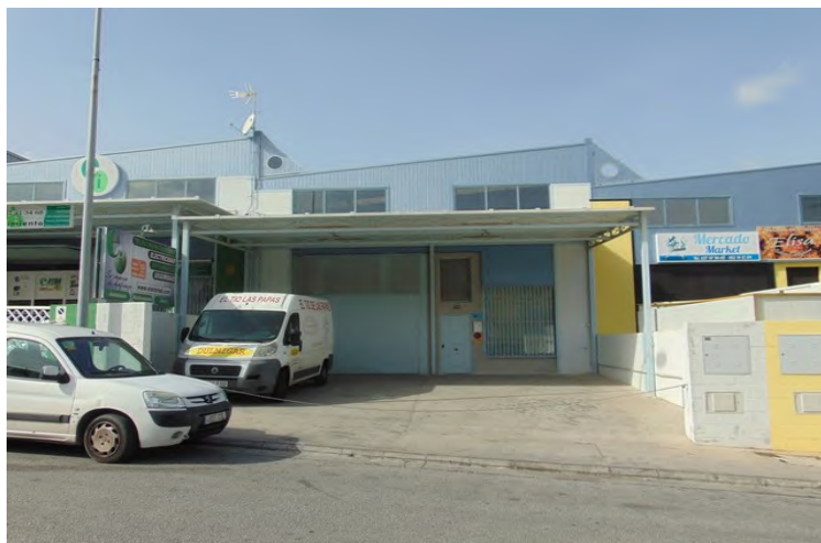
Foto 1. Vista de la estructura objeto del expediente

Las obras consisten en una estructura metálica y techado con placa sándwich con unas medidas de 5'60 mts. x 10'00 mts. (56'00 m 2 ).