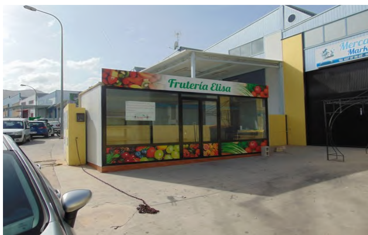
Foto 1. Vista de caseta objeto del expediente

Las obras denunciadas consisten en colocar una caseta prefabricada con una superficie de 10'00 m² (5'00 m x 2'00 m).