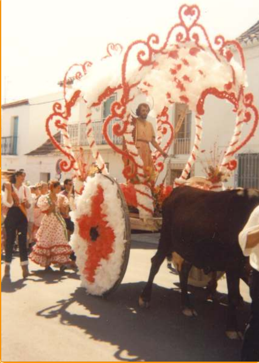
Cortejo antigua Romería de San Juan