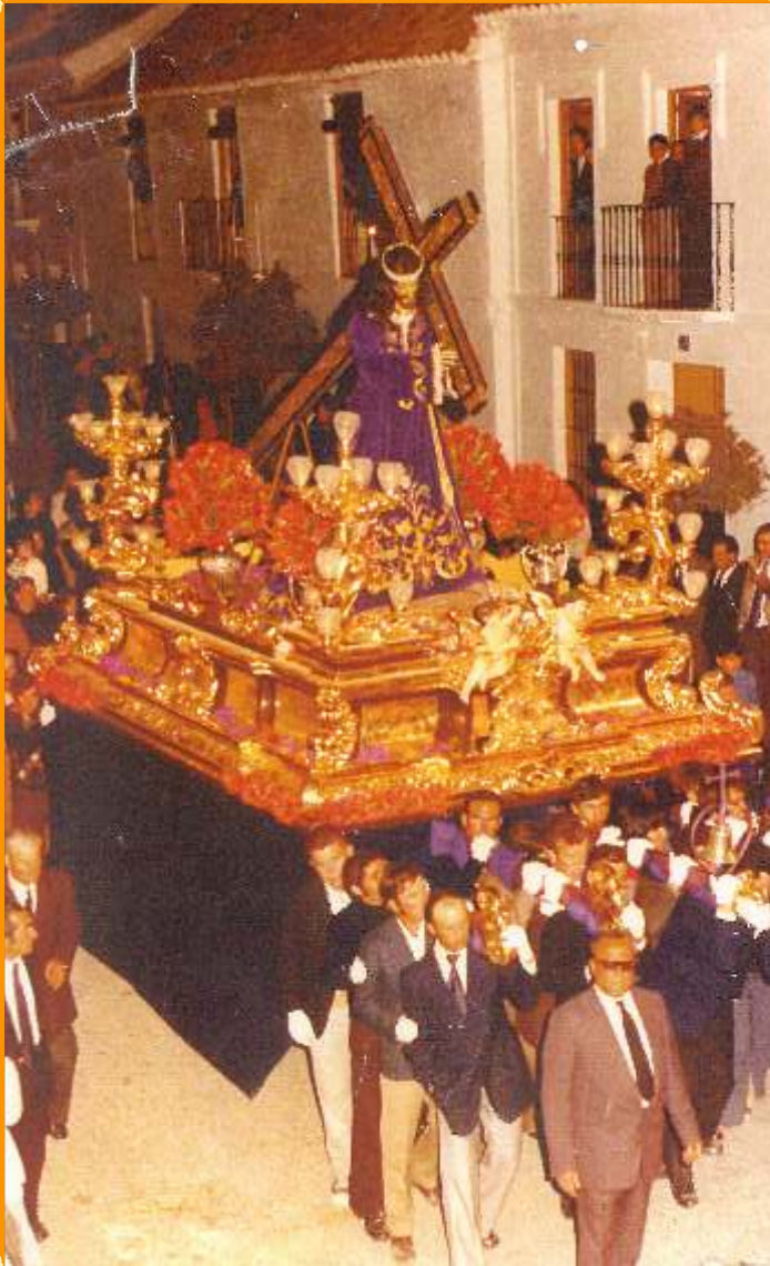
Nuestro Padre Jesús procesionando por las calles del Barrio Viejo