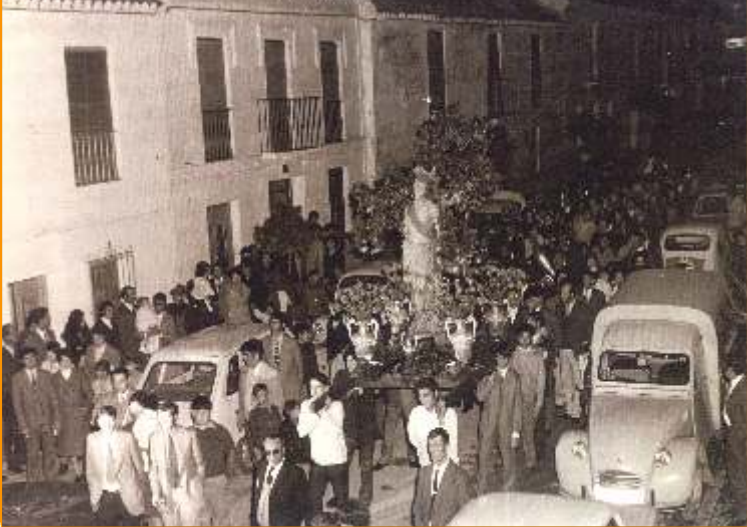
• Antigua procesión del Patrón S. Sebastián •