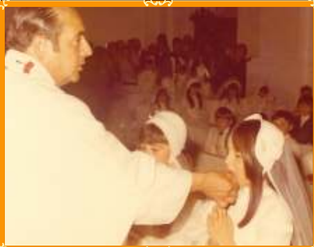
Jóvenes alhaurinas recibiendo su primera comunión