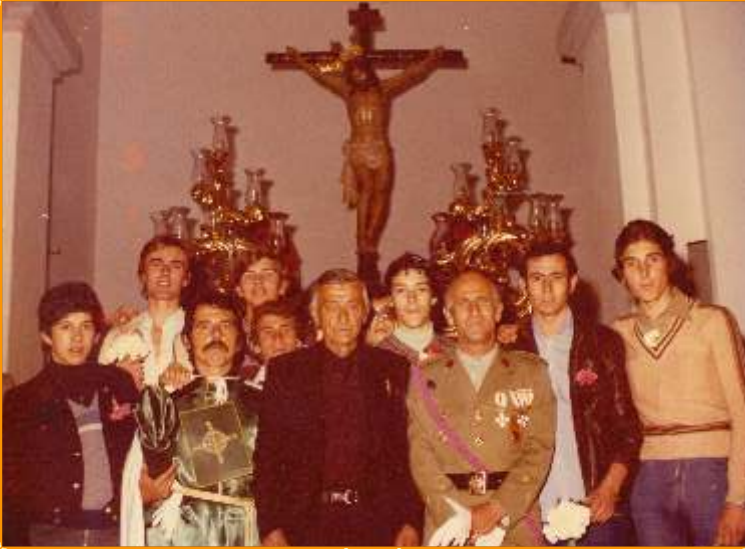
Hermanos de la Cofradía de los Verdes en la celebración del Viernes Santo