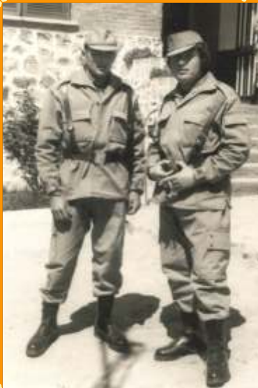
• Jóvenes alhaurinos en el servicio militar •