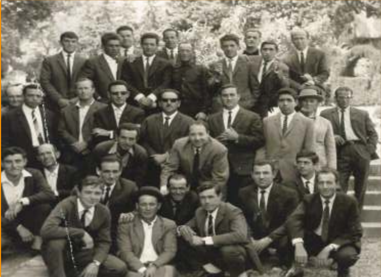
• Grupo de alumnos del PPO •