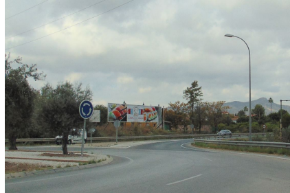
Fotografía realizada en visita de inspección de fecha 10/10/2019

PLAZA DE LA JUVENTUD, S/N C.P. 29130 TELF. 952 41 71 50/51 informacion@alhaurindelatorre.es