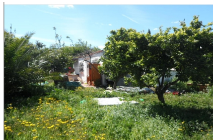
Estado de la vivienda anterior a la nueva construcción realizada (fachada principal)

De todo lo anterior se concluye lo siguiente: