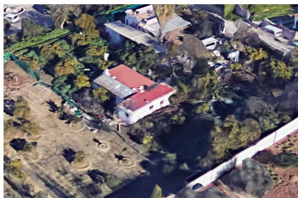
Estado de la vivienda anterior a la nueva construcción realizada (vista Norte)

PLAZA DE LA JUVENTUD, S/N C.P. 29130 TELF. 952 41 71 50/51 informacion@alhaurindelatorre.es