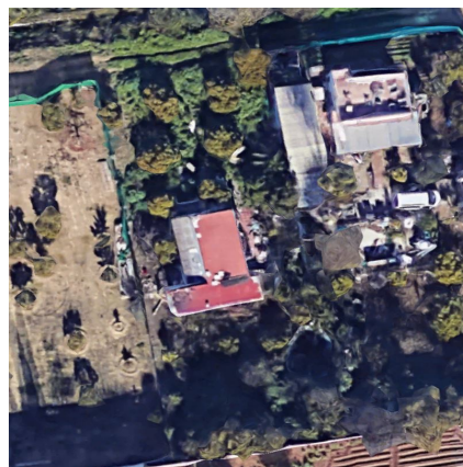
Estado de la vivienda anterior a la nueva construcción realizada (planta)

Para comprobar cuales han sido las obras realizadas, se ha consultado el programa Google Earth Pro y de la Sede Electrónica de Catastro para de esta forma observar cual era el estado de la vivienda antes de la construcción denunciada (año 2018-2019), exponiéndose las mismas a continuación: