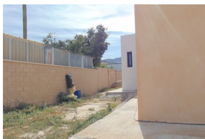
Fotografías exterior construcción vivienda nueva realizadas en visita de inspección (18/10/2019)