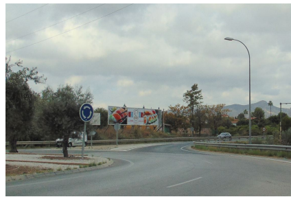
Fotografía realizada en visita de inspección de fecha 10/10/2019

4º.-De acuerdo con los datos consultados en la Delegación de Urbanismo, los actos se han realizado sin la preceptiva licencia municipal de obras