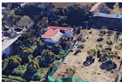
Estado de la vivienda anterior a la nueva construcción realizada (vista Sur)