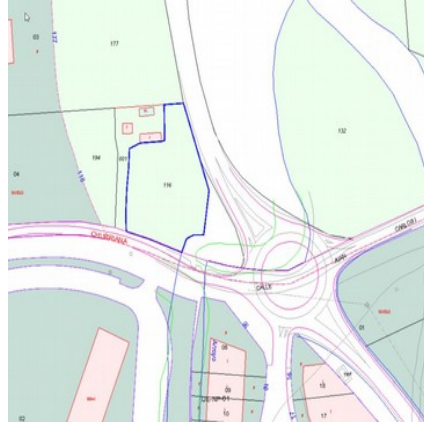
Parcela catastral (Oficina Virtual Catastro)

PLAZA DE LA JUVENTUD, S/N C.P. 29130 TELF. 952 41 71 50/51 informacion@alhaurindelatorre.es