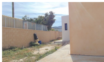
Fotografías exterior construcción vivienda nueva realizadas en visita de inspección (18/10/2019)