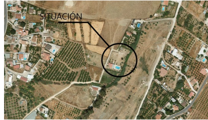
Fotografía aérea de la parcela donde se observan las edificaciones de fecha julio de 2005

Por parte del técnico firmante se ha comprobado que efectivamente las edificaciones objeto del expediente (vivienda unifamiliar aislada y construcciones anexas) aparecen en la fotografía aérea que de fecha JULIO 2005, por la que la antigüedad de la vivienda es de al menos JULIO DE 2005.