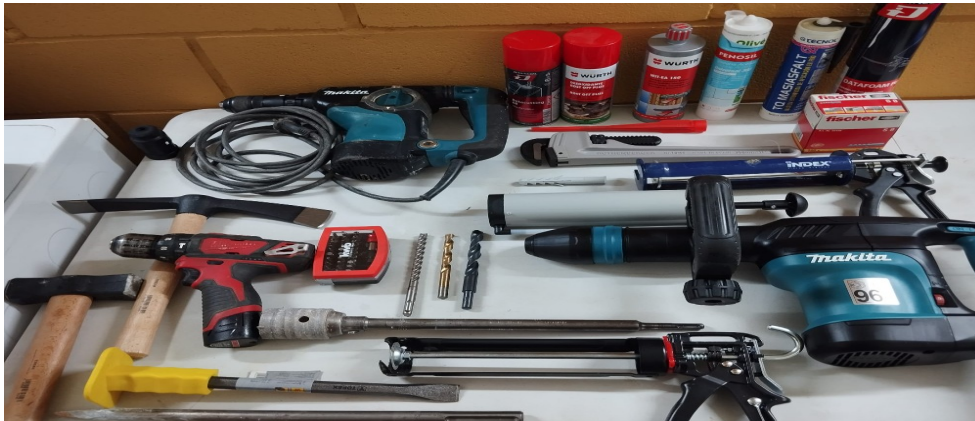
Imagen del material que se encontraran los opositores en la mesa

Materiales que deben seleccionar y posición correcta del taladro percutor con la broca correspondiente