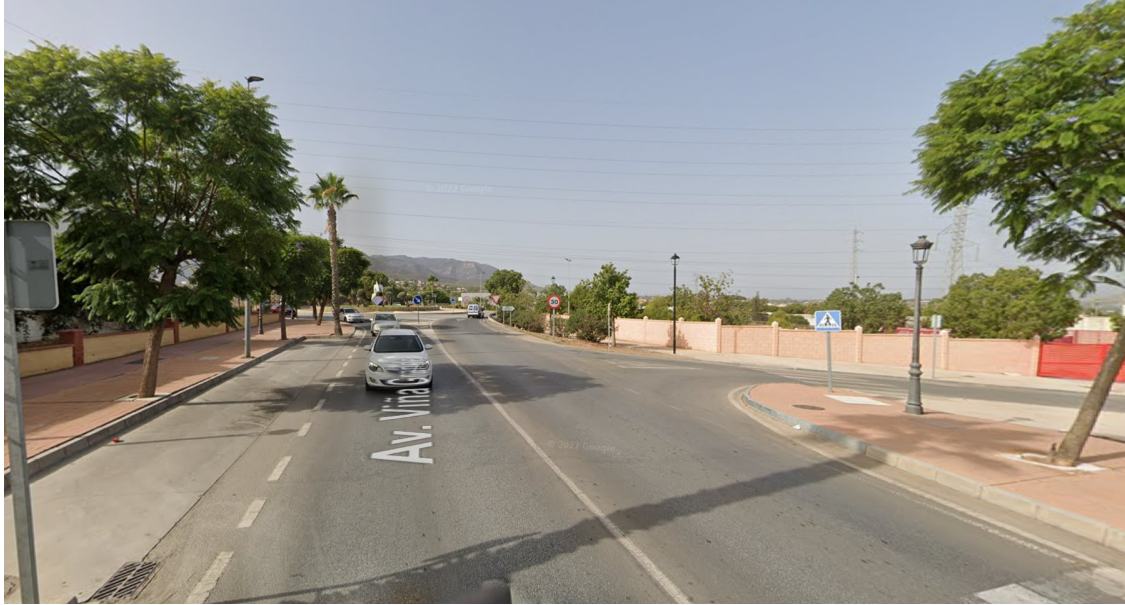
Avda. Reyes Católicos salida Viñagrande

Nº Entidad Local 01-29007-5 C.I.F.: P-2900700-B