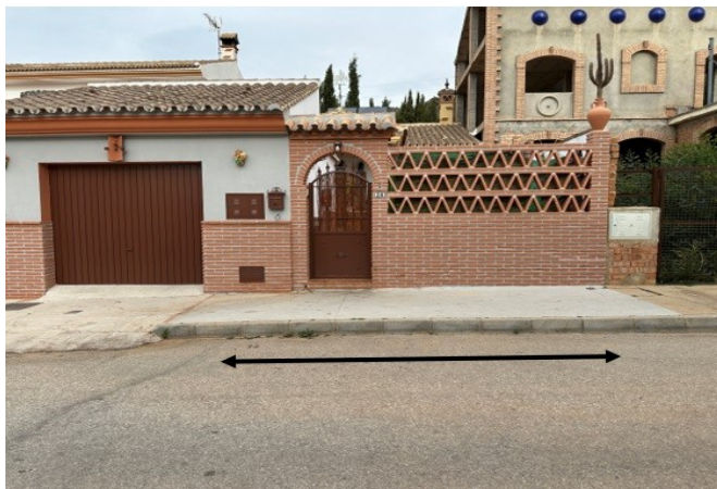
Fdo.: El Oficial de Policía Local C.P. 3867

Alhaurín de la Torre, en la fecha de la firma digital del documento